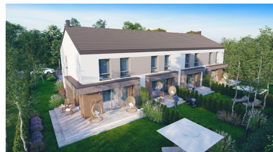
Łajski - budynek A lok.1 pow. 102,66 m 2